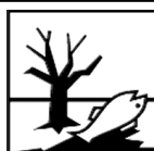
Produkt niebezpieczny dla środowiska

Oznakowanie zagrożenia: Produkt szkodliwy; Produkt skrajnie łatwopalny; Produkt niebezpieczny dla środowiska